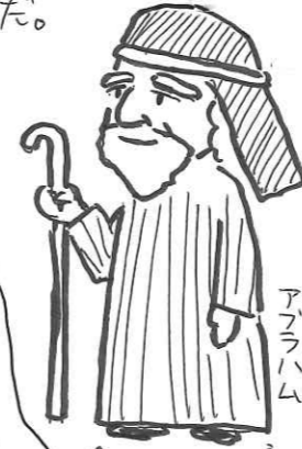
↑ イエスさまが生まれる 2,000かんまごの 人だよ!

この神さまの救いの「ご計画」は、イエスさまが 生まれる前から、神さまが「前から」 にしていたことなんだ。 神さま、すごいわ!